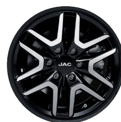
Felgi: Aluminiowe 18"