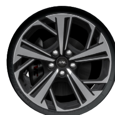
Felgi: Aluminiowe 18"